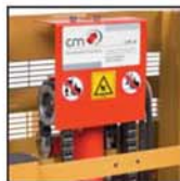
Catene di sollevamento tipo "Fleyer" "Fleyer" type lifting chains