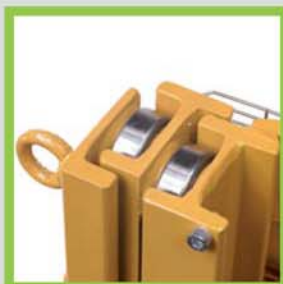
Profili in acciaio laminati a caldo Hot-rolled steel profiles