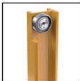
Cuscinetti radiali a rulli cilindrici Straight roller radial bearings