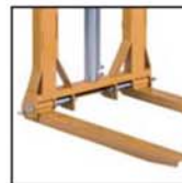
Forche pieghevoli e regolabili Adjustable and pliable forks