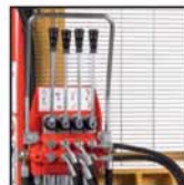
Distributore 4 leve Distributor with 4 levers