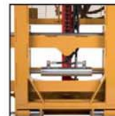
Traslatore laterale Side shift